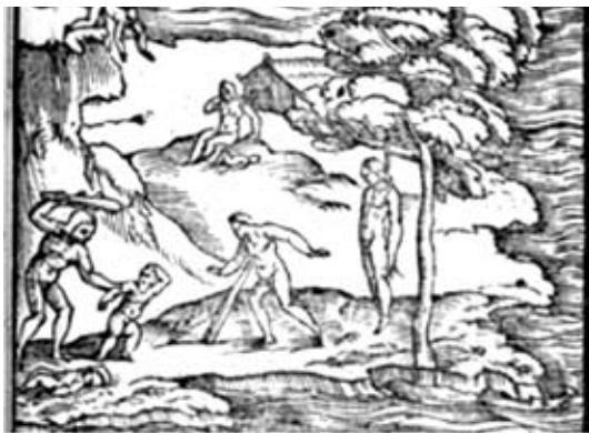
Girolamo Benzoni, Storia del Nuovo Mondo . Stampa raffigurante il suicidio degli Indios per sfuggire agli Spagnoli, dall'edizione inglese, Londra 1857 (Pérez, 4).

Tabelle e raffigurazioni sono abbondanti e molto intense.